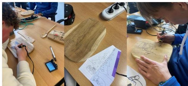
Klassen 5CM en 6CM

Met veel geduld, concentratie en vooral plezier maakten ze prachtige houten plankjes helemaal in kersthema. Mooie resultaten om trots op te zijn!