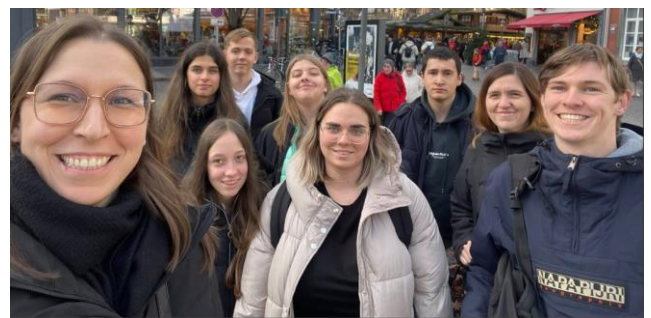
Klassen 5 00&S en 600&S

Kortom, een geslaagde uitstap vol sfeer, nieuwe inzichten en heel wat leerrijke momenten. Ein wunderschöner Tag, an dem wir viel gelernt und entdeckt haben!