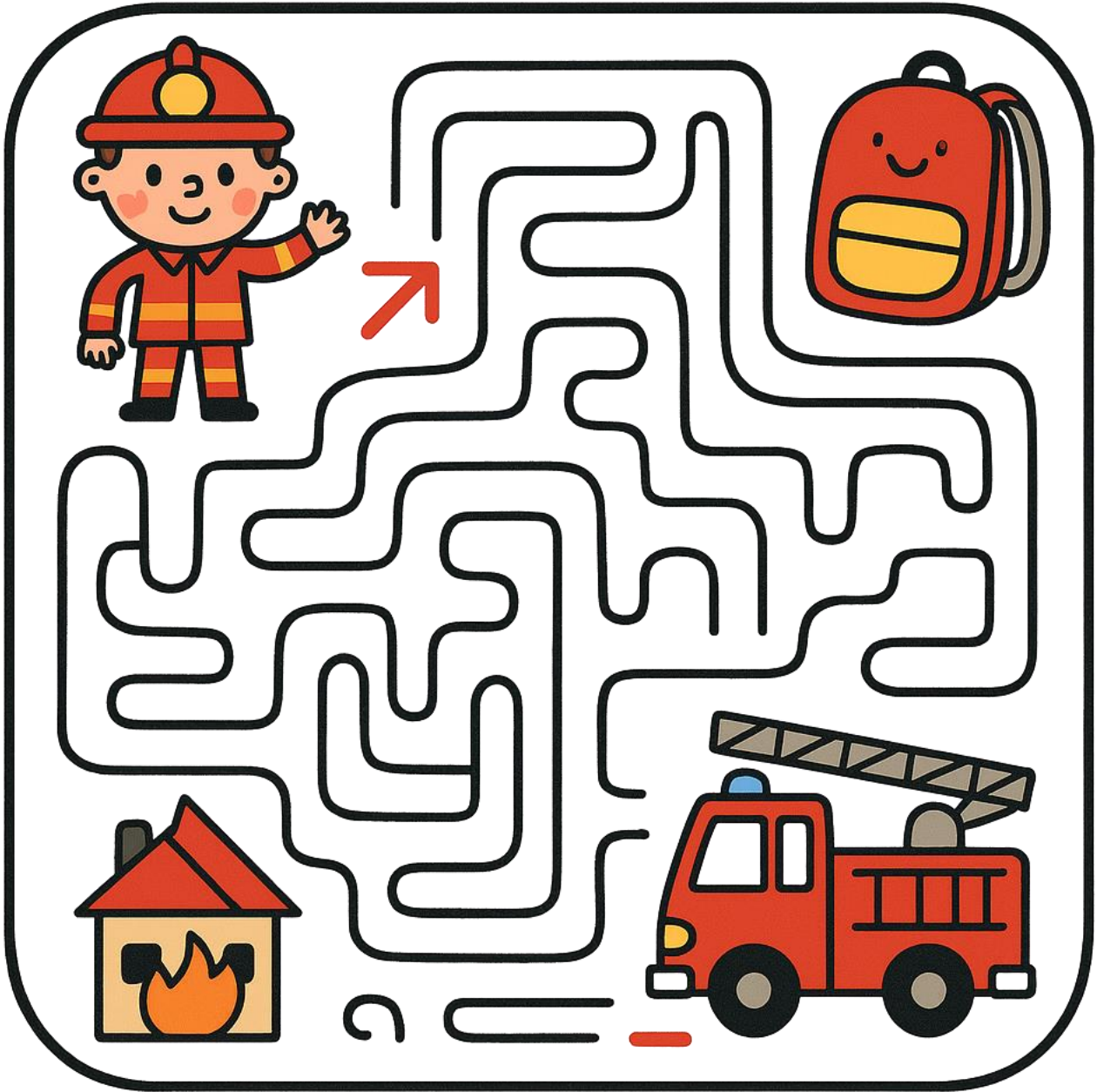
Een door AI gegenereerde afbeelding